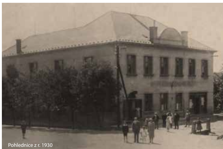
Pohlednice z r. 1930