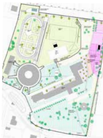
Nová podoba sportovišť u ZŠ Líbeznice. Autor: Arch. J. Hájek