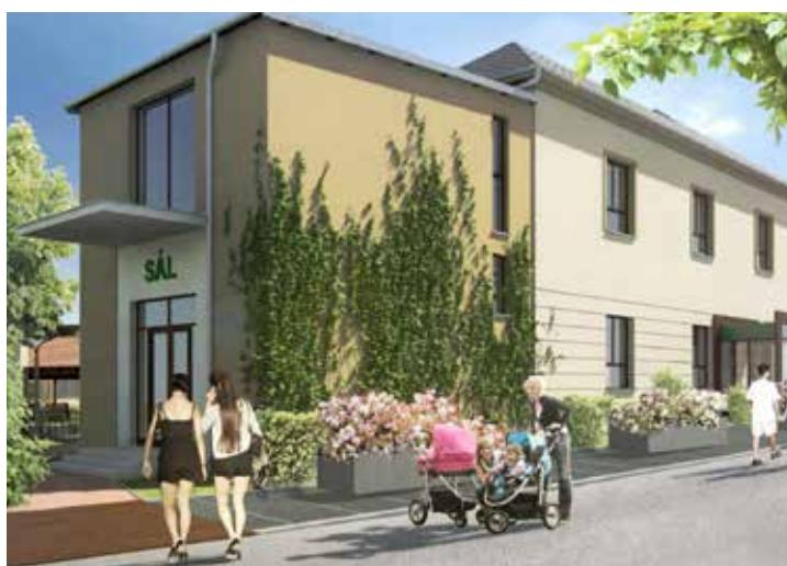
Vstup do sálu U Oličů. Obrázek: Hexaplan s.r.o.