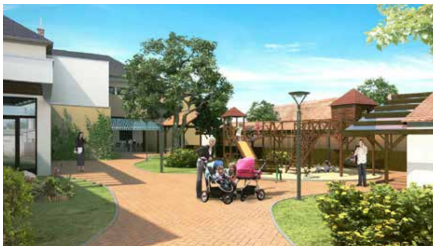
Zahrada ve vnitrobloku U Oličů.