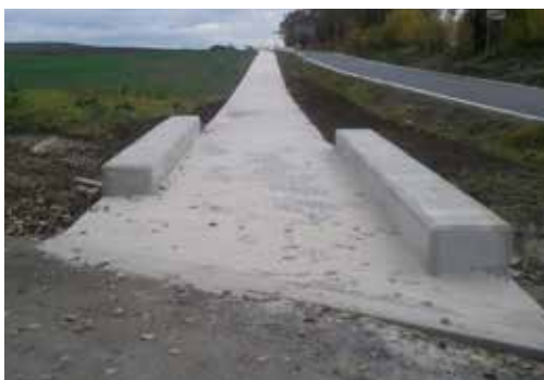
Cyklostezka se dočká pokračování.

Máme pro vás dvě zprávy – jednu špatnou, jednu dobrou. Silnice z Baště do Líbeznic bude uzavřena pravděpodobně až do konce července, ale odměnou nám bude pokračování cyklostezky z Baště až k autobusové zastávce u pošty. „Líbeznicím se podařilo získat dotaci na dvoumilionový projekt dostavby cyklostezky ze Státního fondu dopravní infrastruktury a my tak můžeme 600 tisíc z rozpočtu použít na jinou investiční akci. Díky dokončenému úseku cyklostezky na území Líbeznic tak