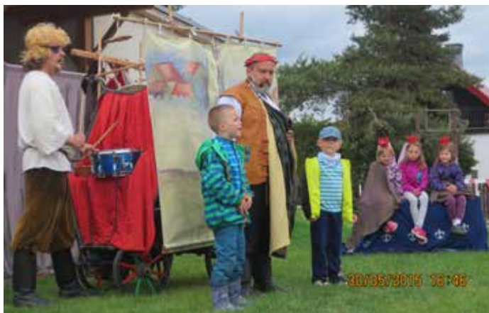
V pohádce účinkovalo i několik dětí z Baště.