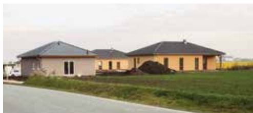
Kam až porostou hranice obce?