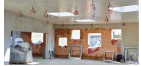
Na Rondelu už se připravuje elektroinstalace