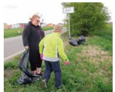
Na pět desítek občanů uklízelo Bašť

Při sobotním úklidu bylo nasbíráno více než 20 velkých odpadkových pytlů, někteří dobrovolníci si sebou přinesli hrábě nebo jiný nástroj na uvolnění nebo zvedání odpadků. Uklízená místa se snad na delší dobu stanou příjemným místem a zejména dobrou vizitkou při příjezdu do obce. Přestože počasí úklidové akci poměrně přálo, sešlo se pouze 17 občanů i s dětmi. Všem, kdo přidali ruku k dílu, patří velký dík. (lis)