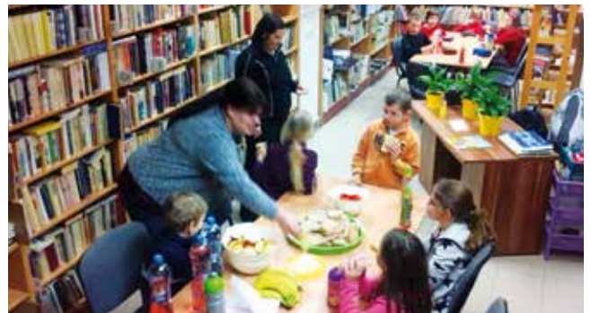
Spáček v knihovně vyhládko

Čas neúprosně běžel a začali jsme se pomalu přesouvat do Pohody a chystat spaní a druhou večeri. Dětem jsme na dobré spaní do spacáku pustili pohádku Tři bratři a v půl jedné už všechny spaly. Dětem i organizátorkám Míše Jahodové, Štěpánce Pokorné a Ladce Megerové se akce moc líbila a věříme, že příští rok se znovu s malými spáči potkáme. Děkujeme obci Bašť za finanční podporu a Obecní knihovně za poskytnutí prostoru. (bastsebavi)