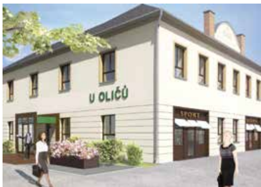
I tak by mohl vypadat společenský dům na Návsí Obrázek: Hexaplan

Již v minulém vydání Zpravodaje jste mohli zaznamenat informaci ze zasedání zastupitelstva obce, že obec schválila záměr koupě objektu čp. 52 za cenu necelých 8,5 milionů korun. Pro definitivní rozhodnutí zastupitelstva a přípravu kupní smlouvy nechala obec zpracovat vlastní znalecký posudek pro stanovení ceny, Komerční banka vyhodnotila finanční možnosti obce splácet dlouhodobý investiční úvěr a architektonická kancelář připravila možné varianty rekonstrukce objektu společně se zahradou včetně odhadu ceny za rekonstrukci. Do uzávěrky vydání Zpravodaje nebylo rozhodnutí zastupitelstva známo. Informaci vám přineseme v nejbližším vydání Zpravodaje.