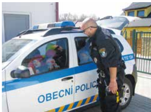
Preventivní program OP v MŠ děti nadchnul

Obvodní oddělení Policie ČR předložilo zastupitelstvu obce zprávu o bezpečnostní situaci v obci Bašť. Zde zkrácená zpráva: