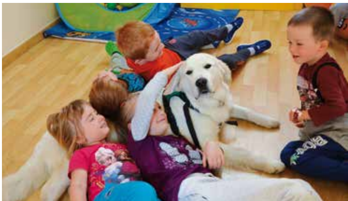
Ukázka canisterapie ve školce SMILE.