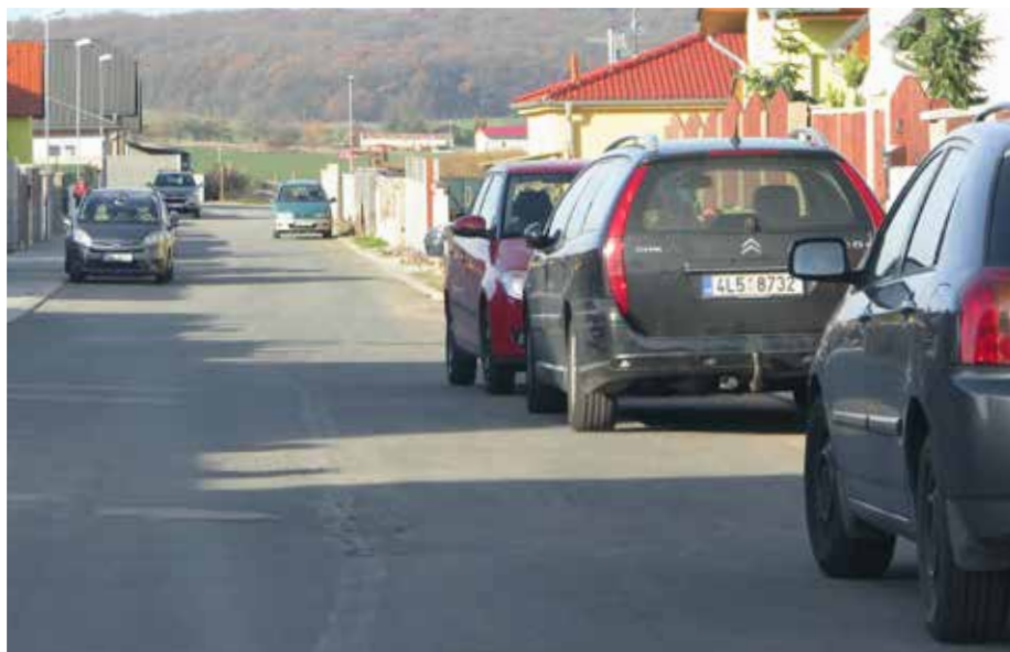
Parkování v ulicích Nad Dvorem není legální.