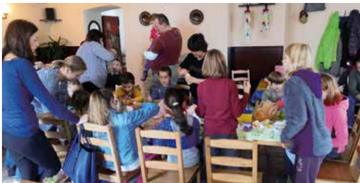
Tvůrčí hemžení na podzimní dílně.