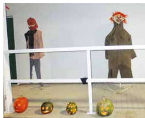
Cíl halloweenského průvodu rozsvítily vydlané dýně.