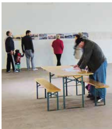
Sál U Oličů si přišlo prohlédnout na desítky návštěvníků.