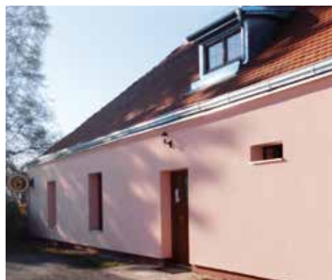
Vila dostává nový kabát.