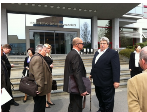
Ing. Utěkal ze spolku Klidná Bašť spolu s hejtmánem Středočeského kraje čekají na přijetí u ministra