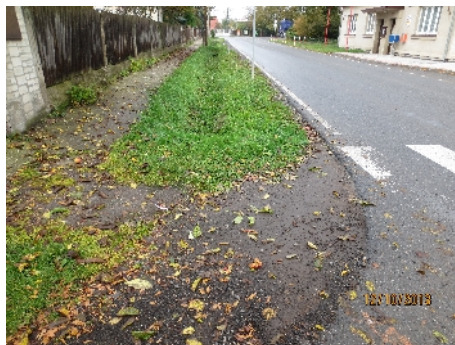
Současné „chodníky“ budou již brzy minulostí

Práce na rekonstrukci chodníků budou zahájeny v dubnu, dokončeny by měly být do konce června. Opraveny budou chodníky podél Hlavní, to znamená od parku až po fotbalové hřiště, u kterého bude posunut přechod pro chodce směrem do centra obce a dále za fotbalovým hřištěm na druhé straně vozovky až k novému chodníku. Dále také bude rekonstruována část chodníku v ulici K Beckovu až za mateřskou školou. Celkové výdaje projektu dosáhnou výše přes 1,5 milion korun, které budou plně hrazeny z rozpočtu obce.