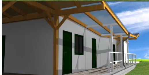
Nové fotbalové kabiny na obrázku autora projektu