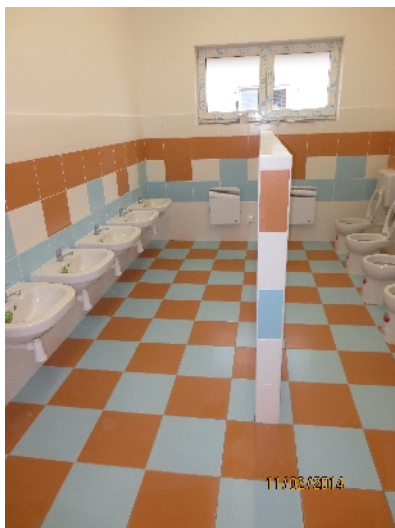
Interiér nové budovy v modré a oranžové barvě

Již v tomto týdnu až do 11. března si mohou rodiče dětí s trvalým bydlištěm v Bašti vyzvedávat v původní budově MŠ Bašt, K Beckovu 142, každý den vždy od 7 do 16 hodin, formuláře přihlášek k přijetí.